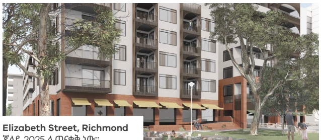
Elizabeth Street, Richmond ጁላይ 2025 ሊጠናቀቅ ነው።