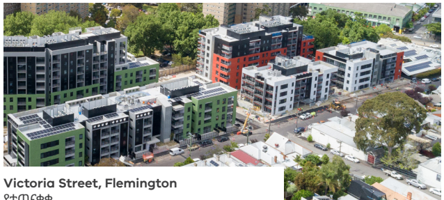
Victoria Street, Flemington የተጠናቀቀ