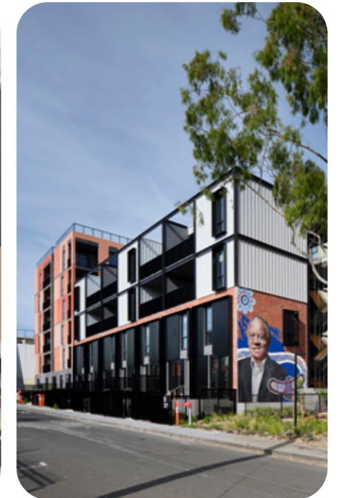
Bangs Street, Prahran