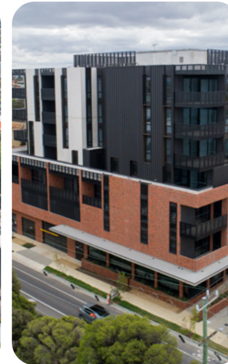
Oakover Road, Preston