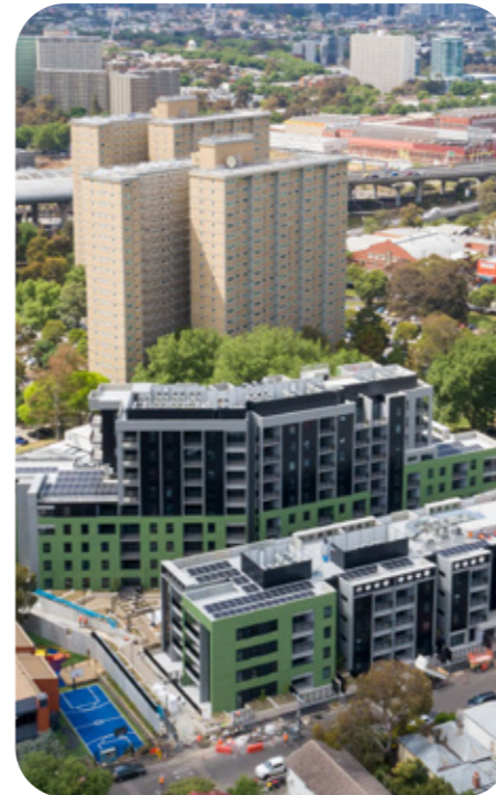
Victoria Street, Flemington