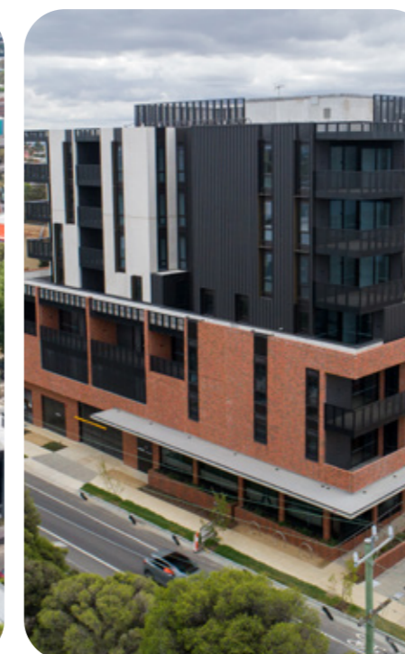
Oakover Road, Preston