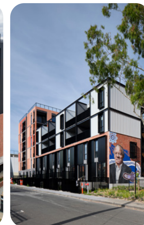
Bangs Street, Prahran