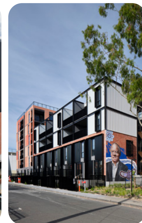
位于 Prahran 的 Bangs Street