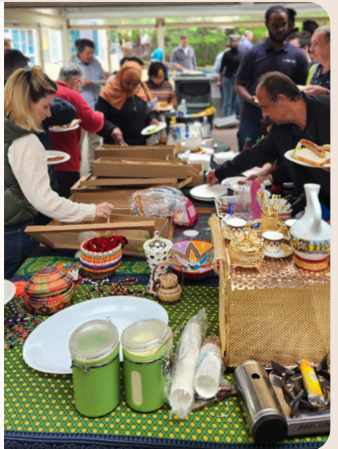
ተቃራኒ:- ተከራዮች በሰሜን ሜልበርን ኮሚኒቲ ባርቤኪው እየተዘናኙ

እንደ ፔቪንግ ዘወይ ፎርዋርድ (Paving the Way Forward) ተነሳሽነት አካል፣ ባለፈው አመት መጨረሻ ከሰሜን ሜልበርን ቋንቋ እና ትምህርት ጋር በመተባበር የማህበረሰብ ባርቤኪው ተካሂዷል። ይህ ክስተት የሰሜን ሜልበርን እና የፍሌምንግተን ነዋሪዎችን ጎረቤቶቻቸውን እና የማህበረሰብ አገልግሎት ሰጪዎችን እንዲገናኙ አድርጓል። ከአየሩ ጥሩ የአየር ጠባይ ጎን ለጎን የአካባቢውን ማህበረሰብ በጋራ መደገፍ በሚቻልበት ሁኔታ ላይ ሲወያይ ከነዋሪዎች እና አገልግሎት ሰጪዎች ድንቅ ምግብና ቡና እየተዘናኙ ጥሩ ተሳትፎ አድርገዋል።