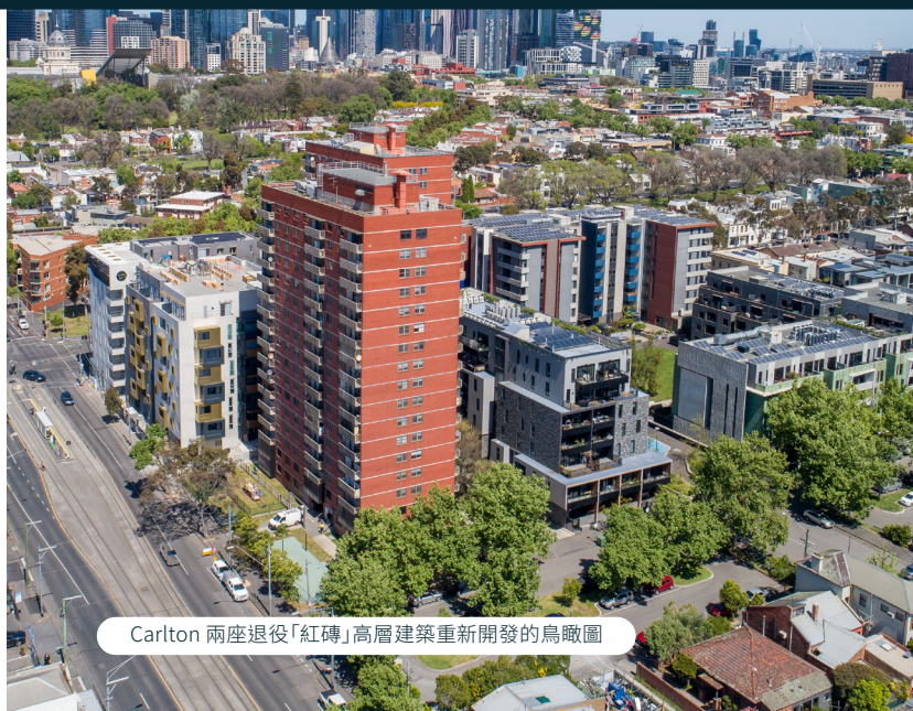
Carlton 兩座退役「紅磚」高層建築重新開發的鳥瞰圖

在本期中，我們將介紹 Carlton 首個高層重建的新住房計劃，以及在 Prahran、South Yarra、Port Melbourne 和 Hampton East 進行「大型住房建設」(Big Housing Build) 計劃的進展情況。所有這些都為更多維多利亞居民提供更多更優質的住房。