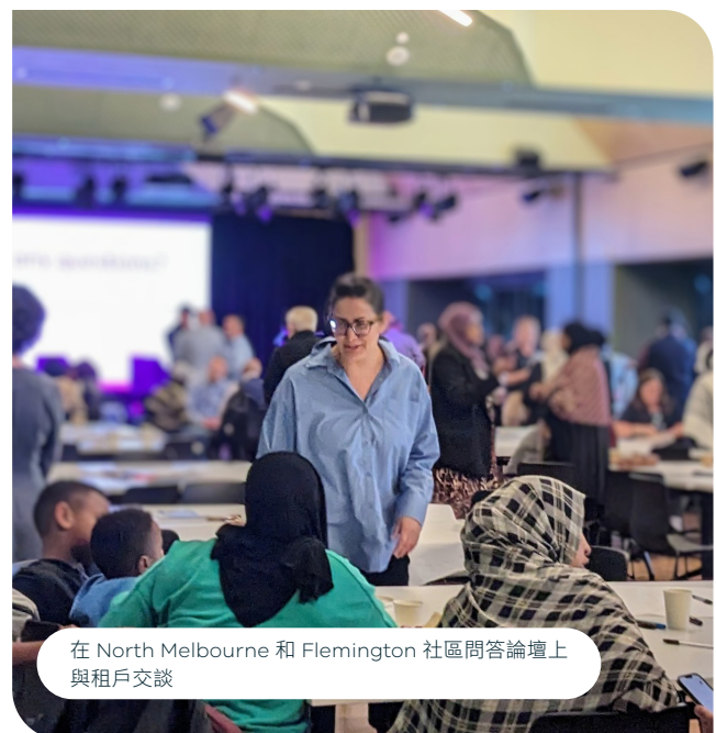
在 North Melbourne 和 Flemington 社區問答論壇上與租戶交談