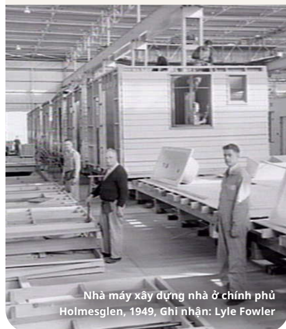
Nhà máy xây dựng nhà ở chính phủ Holmesglen, 1949, Ghi nhận: Lyle Fowler

Chúng tôi đang gia tăng số lượng nhà ở chính phủ lên ít nhất 10 phần trăm trên khắp các khu chung cư cao tầng này.