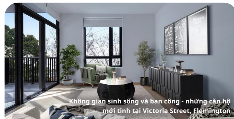
Không gian sinh sống và ban công - những căn hộ mới tinh tại Victoria Street, Flemington

Các khu chung cư cao tầng của chúng tôi đã đứng vững trong gần 70 năm, nhưng bây giờ chúng sắp hết thời hạn hoạt động. 44 khu chung cư cao tầng được xây dựng với các tiêu chuẩn lỗi thời đối với sự tiện nghi về nhiệt độ, tính bền vững, cách âm, thông gió và khả năng tiếp cận. Sau khi đánh giá, chúng tôi nhận thấy rằng các khu chung cư không phù hợp cho việc trùng tu.