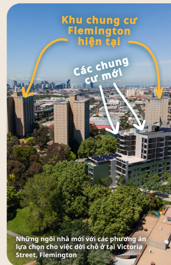
Những ngôi nhà mới với các phương án lựa chọn cho việc dời chỗ ở tại Victoria Street, Flemington