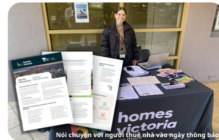
Nói chuyện với người thuê nhà vào ngày thông báo