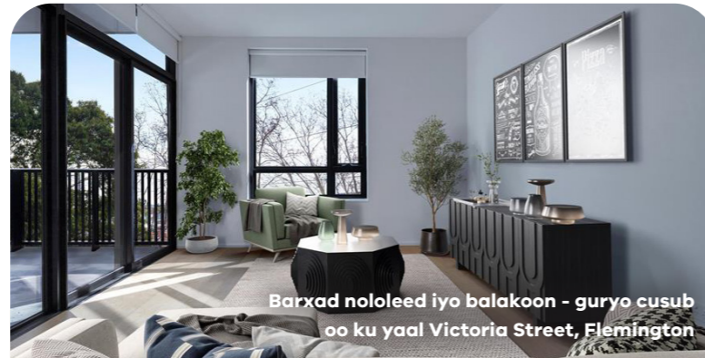
Barxad nololeed iyo balakoon - guryo cusub oo ku yaal Victoria Street, Flemington