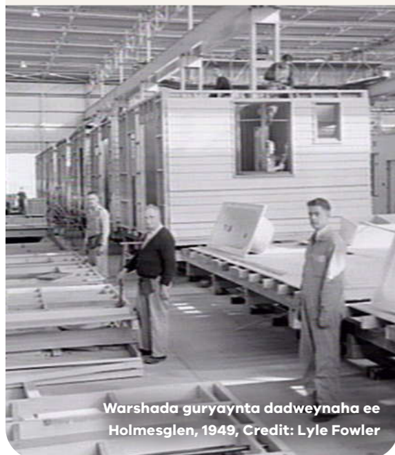
Warshada guryaynta dadweynaha ee Holmesglen, 1949

Dabaqyadeena dhaadheer waxay taagnaayeen ku dhawaad 70 sano, laakiin hadda waxay ku dhowdahay dhammaadka noloshooda shaqo. 44-ta dabaq waxaa lagu dhisay heerar duugoobay oo ah raaxada kulaylka, waaritaanka, daminta qaylada, hawo-qaadista, iyo sida loo geli karo. Ka dib markii aan tixgeliney dib u eegis, waxaan ogaanay in dabaqyada aysan ku habooneyn dayactirka.