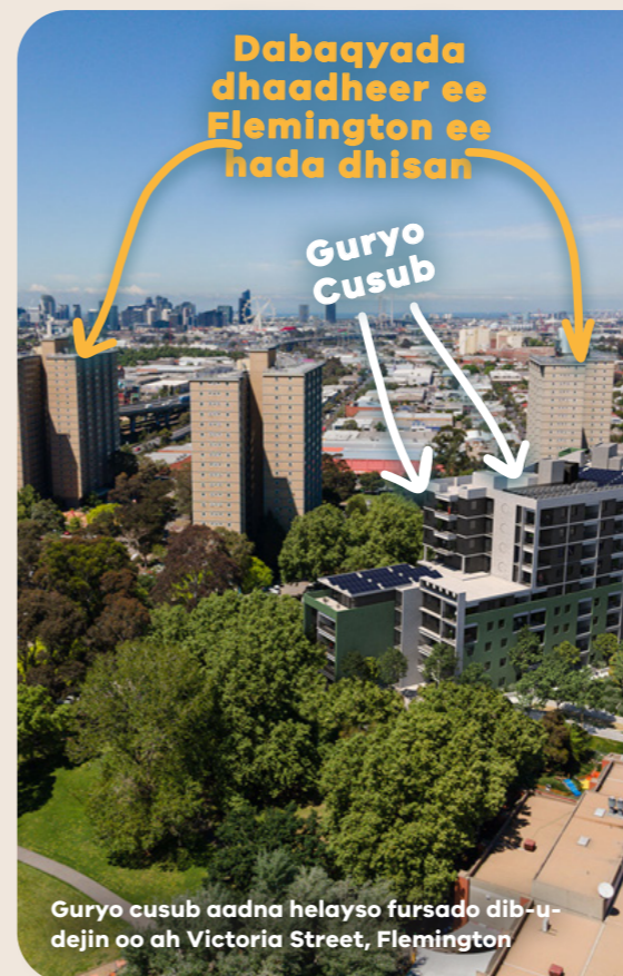
Guryo cusub aadna helayso fursado dib-u-dejin oo ah Victoria Street, Flemington