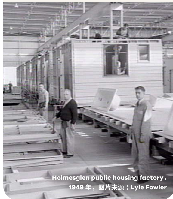
Holmesglen public housing factory, 1949 年