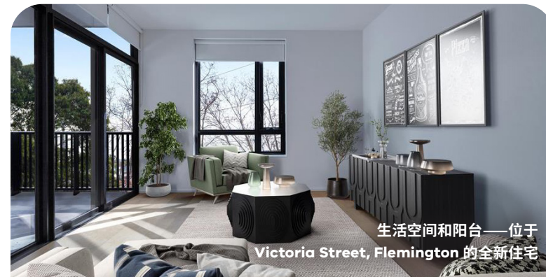
生活空间和阳台——位于 Victoria Street, Flemington 的全新住宅

我们的高层建筑已屹立了近 70 年，但现在已接近其使用寿命的终点。建造这 44 座大楼时的保暖防寒舒适度、可持续性、隔音、通风和无障碍标准均已过时。经过深思熟虑，我们认为这些大楼不适合翻新。