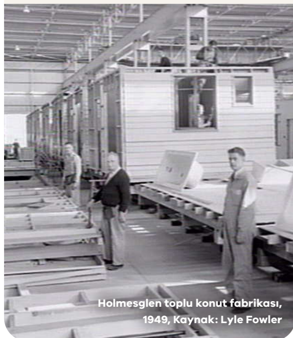
Holmesglen toplu konut fabrikası, 1949, Kaynak: Lyle Fowler

Bu sitelerdeki sosyal konutların sayısını en az yüzde 10 oranında artırıyoruz.