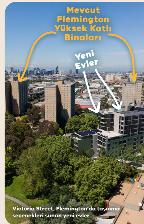
Victoria Street, Flemington'da taşınma seçenekleri sunan yeni evler