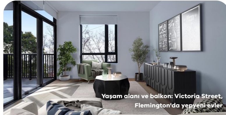
Yaşam alanı ve balkon: Victoria Street, Flemington'da yepyeni evler

Yüksek kulelerimiz yaklaşık 70 yıldır sağlam bir şekilde ayakta duruyor ama artık kullanım ömürlerinin sonuna yaklaşıyor. 44 kule termal konfor, sürdürülebilirlik, ses yalıtımı, havalandırma ve erişilebilirlik konularında eski standartlara göre inşa edilmişti. Yapılan incelemeler sonucunda kulelerin yenilenmeye uygun olmadığını tespit ettik.