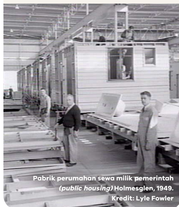
Pabrik perumahan sewa milik pemerintah (public housing) Holmesglen, 1949.

Gedung-gedung bertingkat kami telah berdiri kokoh selama hampir 70 tahun, namun gedung-gedung ini kini mendekati akhir masa operasionalnya. 44 gedung tersebut dibangun dengan standar kenyamanan termal, keberlanjutan, isolasi kebisingan, ventilasi, dan aksesibilitas yang sudah ketinggalan zaman. Setelah melakukan peninjauan, kami menemukan bahwa gedung-gedung tersebut tidak cocok untuk direnovasi.