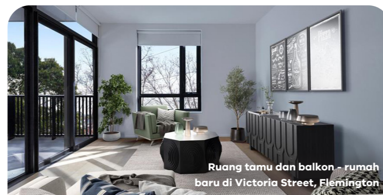
Ruang tamu dan balkon - rumah baru di Victoria Street, Flemington