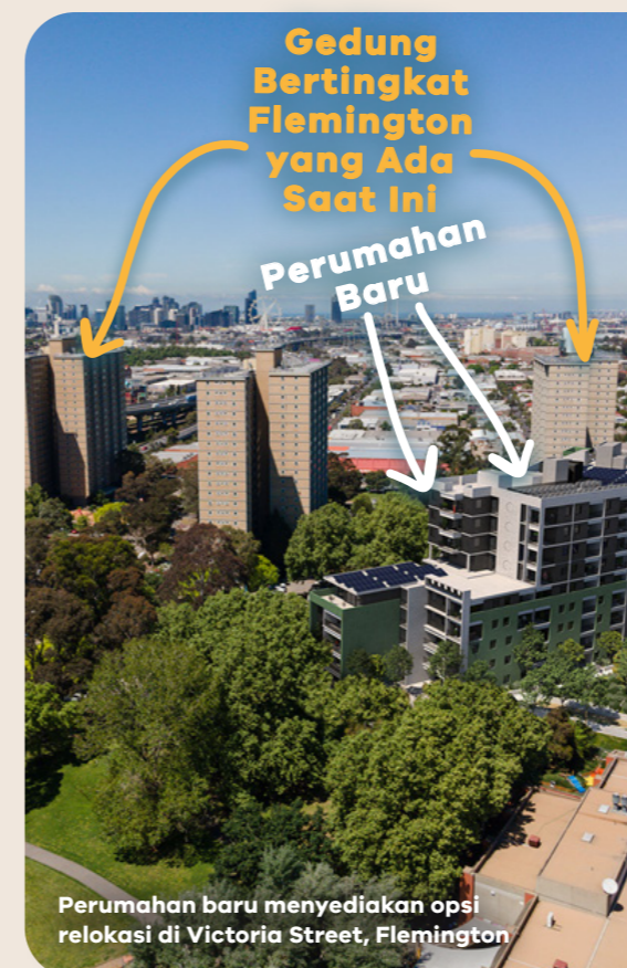
Perumahan baru menyediakan opsi relokasi di Victoria Street, Flemington