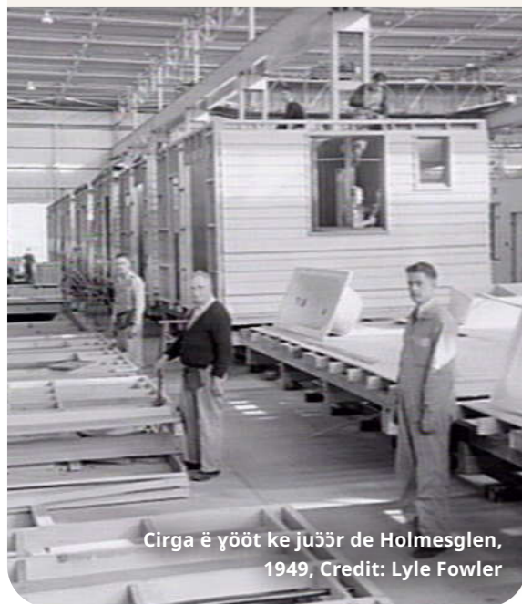
Cirga ë yööt ke juöör de Holmesglen, 1949

Amāraa kuaan lanhial arët aa cē kööc kë ke ril në ka cīt run ka 70, ku yeen emen aa yet në thök ë pīr de luonden. Amāraa kaa 44 aa ke buth/yik keek në kā pieth ke thermal comfort (thāmäl komput) cīke puöl theer, muöökë cök, mēre köu de duot, aliirē bēn yöt, ku yök. Në ciēth cī gam, yok a cukku yök ln cī be amāraa piath bike berpiny në luoi.