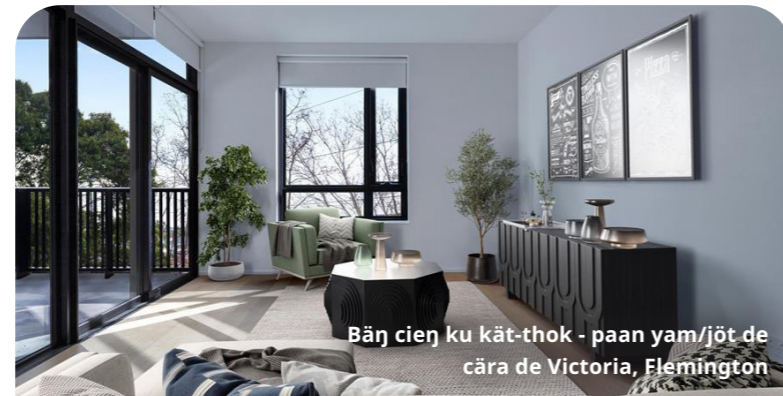
Bānj cien ku kāt-thok - paan yam/jöt de cāra de Victoria, Flemington