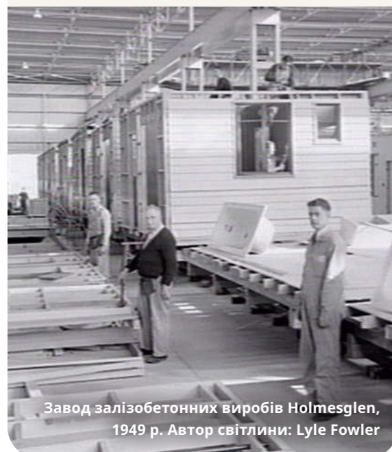
Завод залізобетонних виробів Holmesglen, 1949 р.