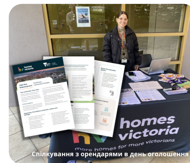
Спілкування з орендарями в день оголошення

Ці добре відвідувані зустрічі дали нам чудову можливість вислухати та відповісти на низку запитань орендарів і взяти до уваги ідеї, думки та відгуки орендарів і громади під час розробки цього важливого проекту.